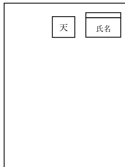
画用紙の裏面（タテ構図）